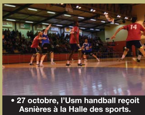
• 27 octobre, l'Usm handball reçoit Asnières à la Halle des sports.