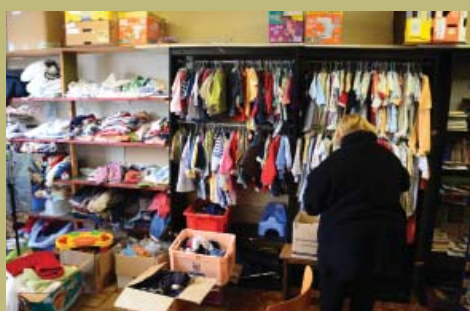
• 17 novembre, le comité local du Secours populaire organise sa traditionnelle braderie rue des Bergeronnettes.