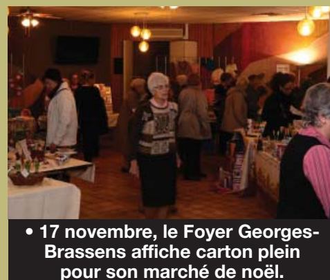
• 17 novembre, le Foyer Georges-Brassens affiche carton plein pour son marché de Noël.