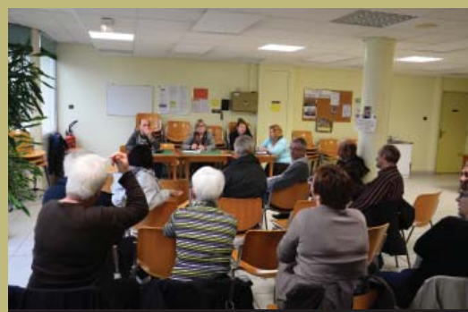
• 20 octobre, à la salle Lucien-Barbier, les administrés dialoguent avec les élus.