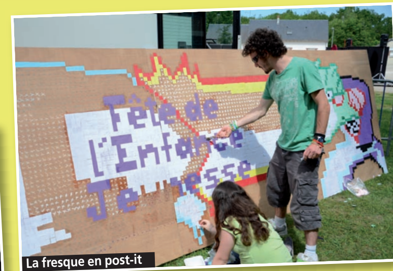
La fresque en post-it