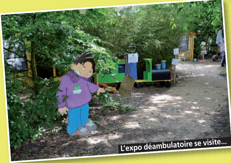
L'expo déambulatoire se visite...