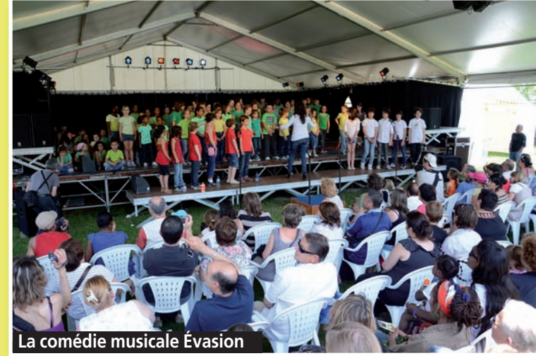
La comédie musicale Évasion