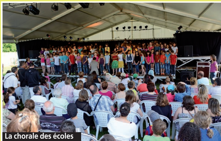
La chorale des écoles

Le 2 juin dernier, s'est tenu la Fête de l'Enfance et de la Jeunesse dans le parc du château de l'étang. Au menu : Plein, Plein, d'activités, de plaisirs, de détente, de rencontres, de curiosités, d'échanges, de farniente, de sourires, de rires, de danse, de musique, de ballades en carriole... Et cerise sur notre gâteau : le soleil s'est proposé, ce jour-là, d'être notre partenaire privilégié... Un choix d'images, non exhaustif, juste pour le plaisir.