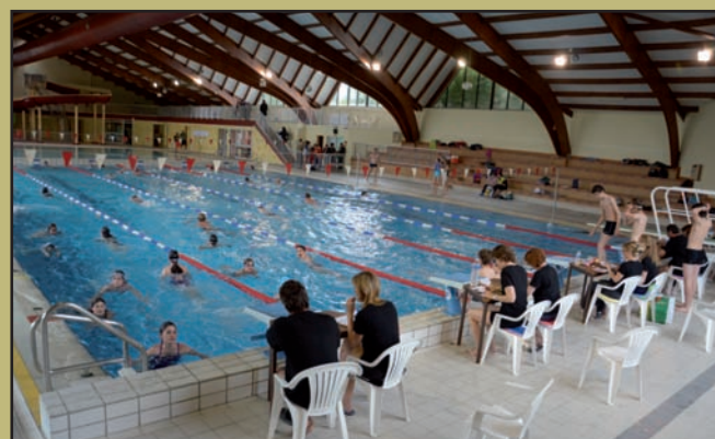
● 16 juin : au centre nautique, l'USM natation présente l'édition 2012 des 6 Heures de natation .