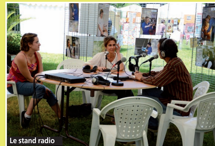
Le stand radio