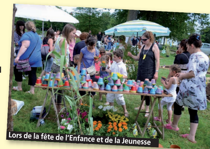
Lors de la fête de l'Enfance et de la Jeunesse

> Du 27 au 31 août, à l'École de musique de 10h à 17h (inscriptions jusqu'au 18 août).