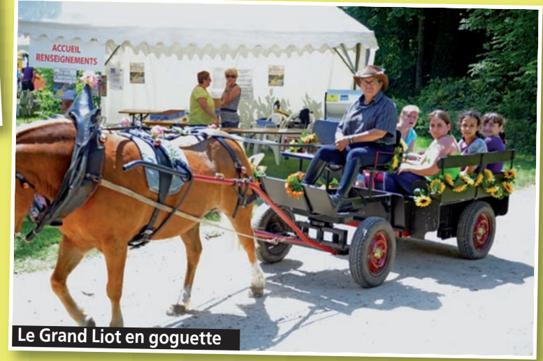
Le Grand Liot en goguette