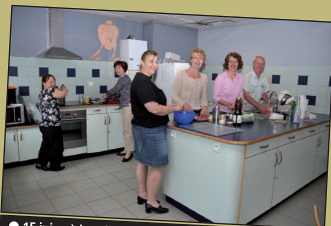
● 15 juin : à la cuisine du local jeunes du Vilpot, la MLC propose ses ateliers Bien être à la cuisine .