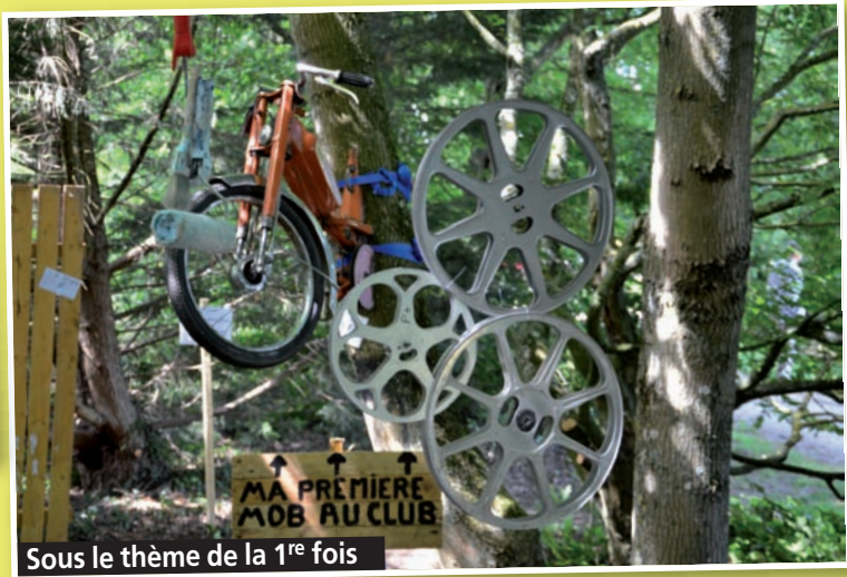
Sous le thème de la 1 re fois