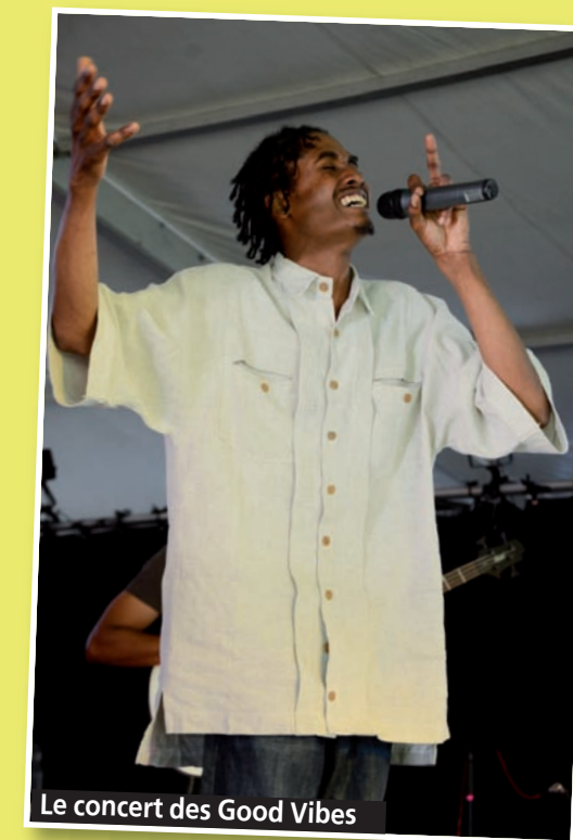
Le concert des Good Vibes