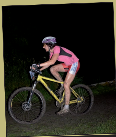
● 16 juin : Le parc du château accueille les 24 heures du VTT.