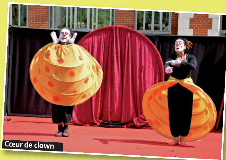
Cœur de clown