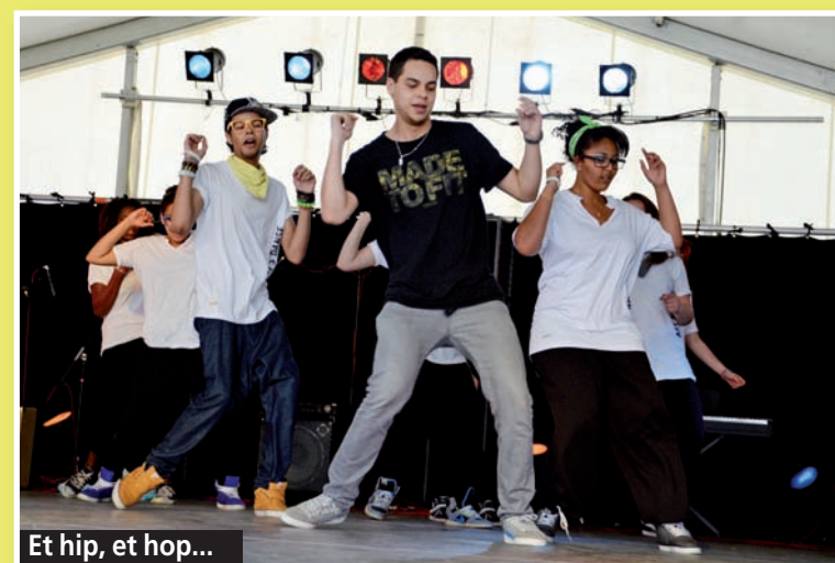
Et hip, et hop...