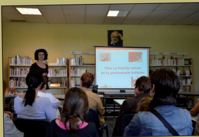
● 6 juin : à la bibliothèque, conférence-découverte sur le thème de la gastronomie italienne, dans le cadre de Partir en... Italie .