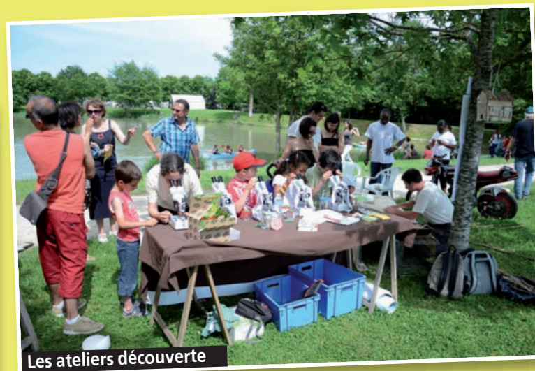
Les ateliers découverte