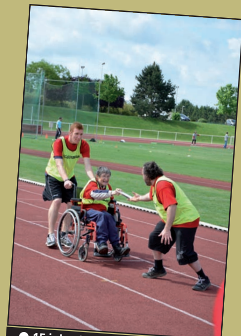
● 15 juin : L'Esat des Cent Arpents organise une journée sportive sur le thème des Jeux olympiques au stade Colette-Besson.