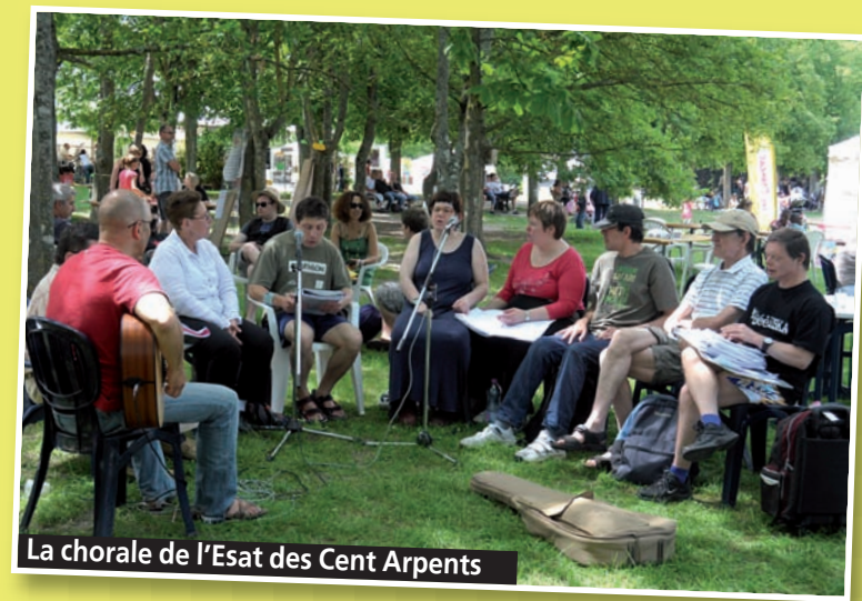
La chorale de l'Esat des Cent Arpents