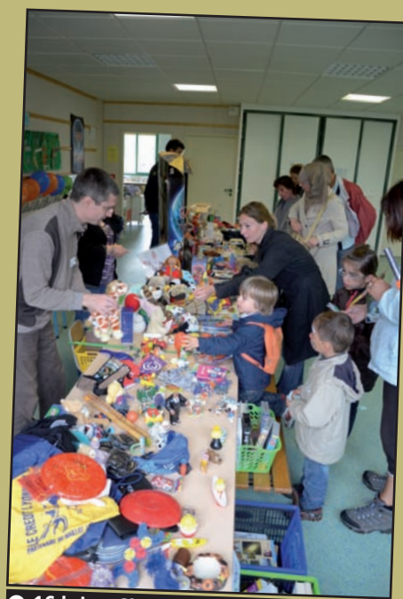
● 16 juin : C'est la kermesse à Pagnol !