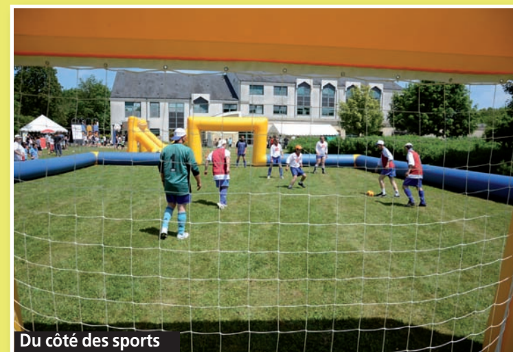
Du côté des sports