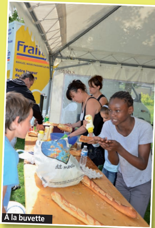
A la buvette