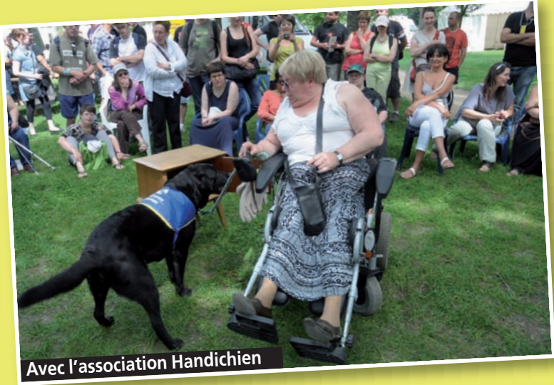
Avec l'association Handichien