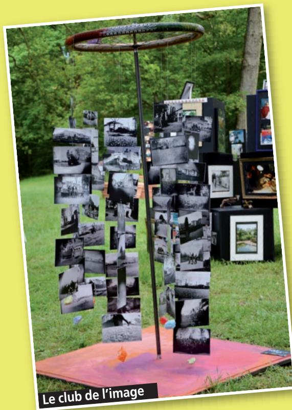
Le club de l'image