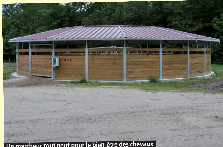
Un marcheur tout neuf pour le bien-être des chevaux

Au cours de la saison passée, le centre équestre a réalisé deux aménagements de taille, la construction d'un marcheur pour les chevaux et la réalisation d'une buvette aux allures de guinguette pour les adhérents et les visiteurs. Et les responsables ne comptent pas en rester là puisqu'ils travaillent actuellement à une réorganisation de l'ancien manège poney. Visite guidée.