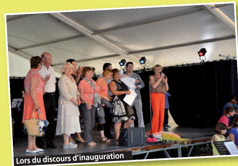
Lors du discours d'inauguration